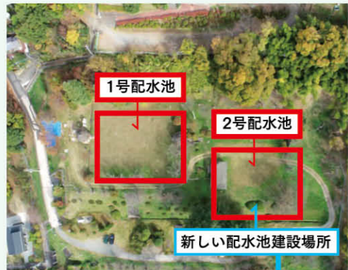
新しい配水池建設場所

中区配水池は、建設から100年以上経過しており、老朽化が進行しています。また、水道施設として求められている耐震基準を満たしていません。安全で安定した水道水をお客様へお届けするために、更新工事を行っています。現在は1号配水池のみで運用しながら、地中にある2号配水池を解体し、新たに地震に強いステンレス製の配水池を地上に建設しています。更新工事完了後は、新しい配水池のみで運用し、1号配水池は配水池としての役目を終えます。