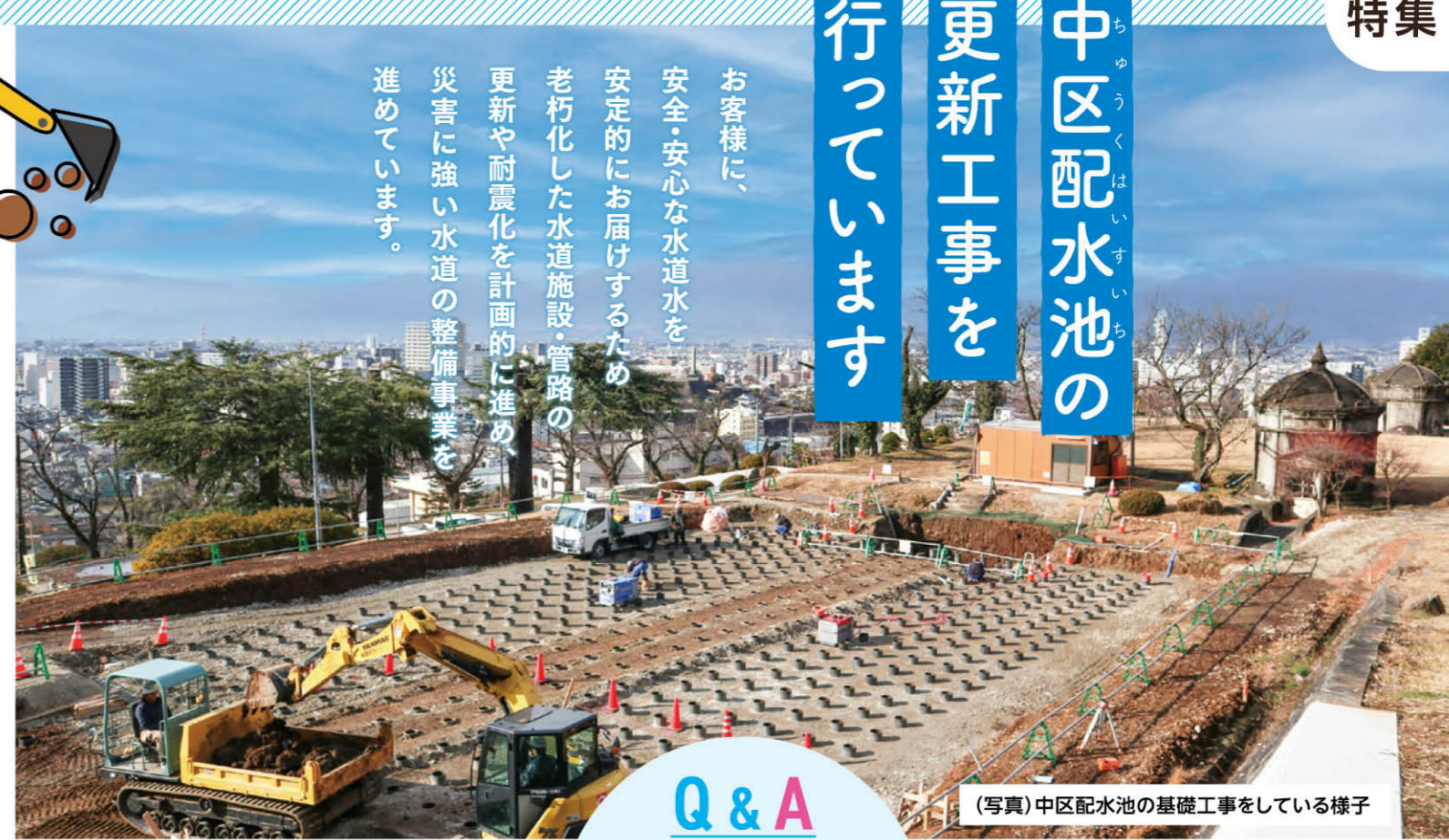
(写真) 中区配水池の基礎工事をしている様子

お客様に、安全・安心な水道水を安定的にお届けするため、老朽化した水道施設・管路の更新や耐震化を計画的に進め、災害に強い水道の整備事業を進めています。