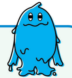
甲府市上下水道局PRキャラクター 水の妖精「ウオツム」